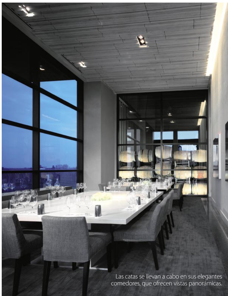
Las catas se llevan a cabo en sus elegantes comedores, que ofrecen vistas panorámicas.

La bodega se ubica en el poblado de Niagara-on-the-Lake, un tranquilo lugar en el que se aprecian hermosos paisajes de vegetación, así como las imponentes cataratas.